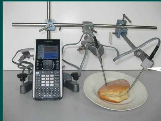
Physik des Apfelkuchens